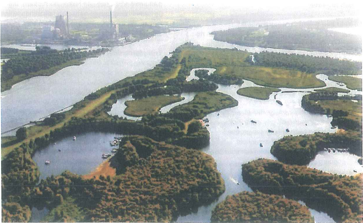
De randen van de Biesbosch met in de nabijheid het Amerterrein

De transformatie van het Amerterrein draagt bij aan de energietransitie én aan de versterking van een van Nederlands mooiste natuurgebieden. Verder betekent het een verbetering van de samenhang tussen natuur en landschap en draagt het bij aan de ontwikkeling van Geertruidenberg als vestingstad aan de Biesbosch.